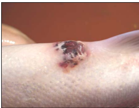
Enghraifft o'r rhefr coch mewn pysgod yn eogffurf aeddfed