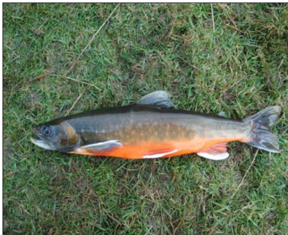
Torgoch Llyn Padarn

Buom yn gweithio â'r tîm asesu pysgodfeydd er mwyn cadw golwg ar dorgochiaid Llyn Padarn, gan ddefnyddio DIDSON a sawl camera tanddwr er mwyn gweld eu silio nhw yn Afon y Bala. Mae nifer y pysgod sy'n silio'n isel anghyffredin ar hyn o bryd: credwn mai dylanwad y tywydd mwyn sydd i'w feio.