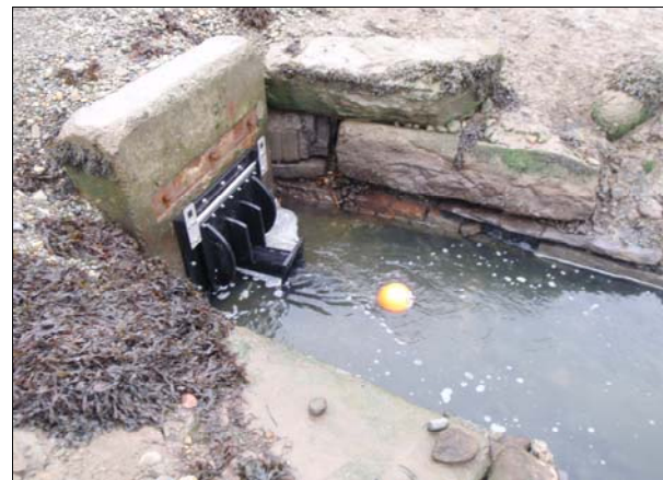
Fflap llanwol ar gyfer llyswennod